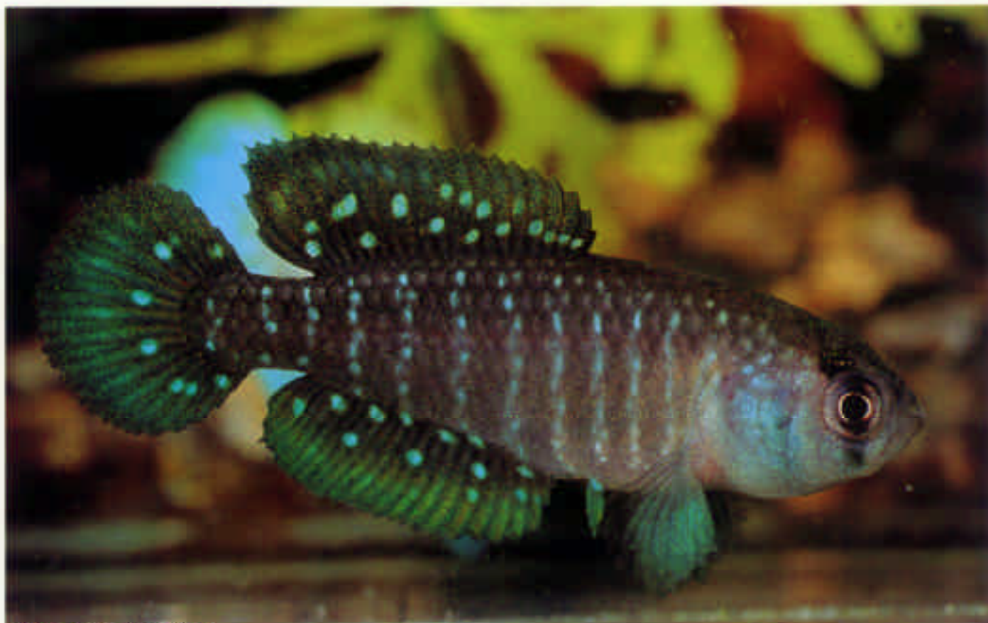
シノレビアス・ドラルズネンシス Cynolebias doraruznensis