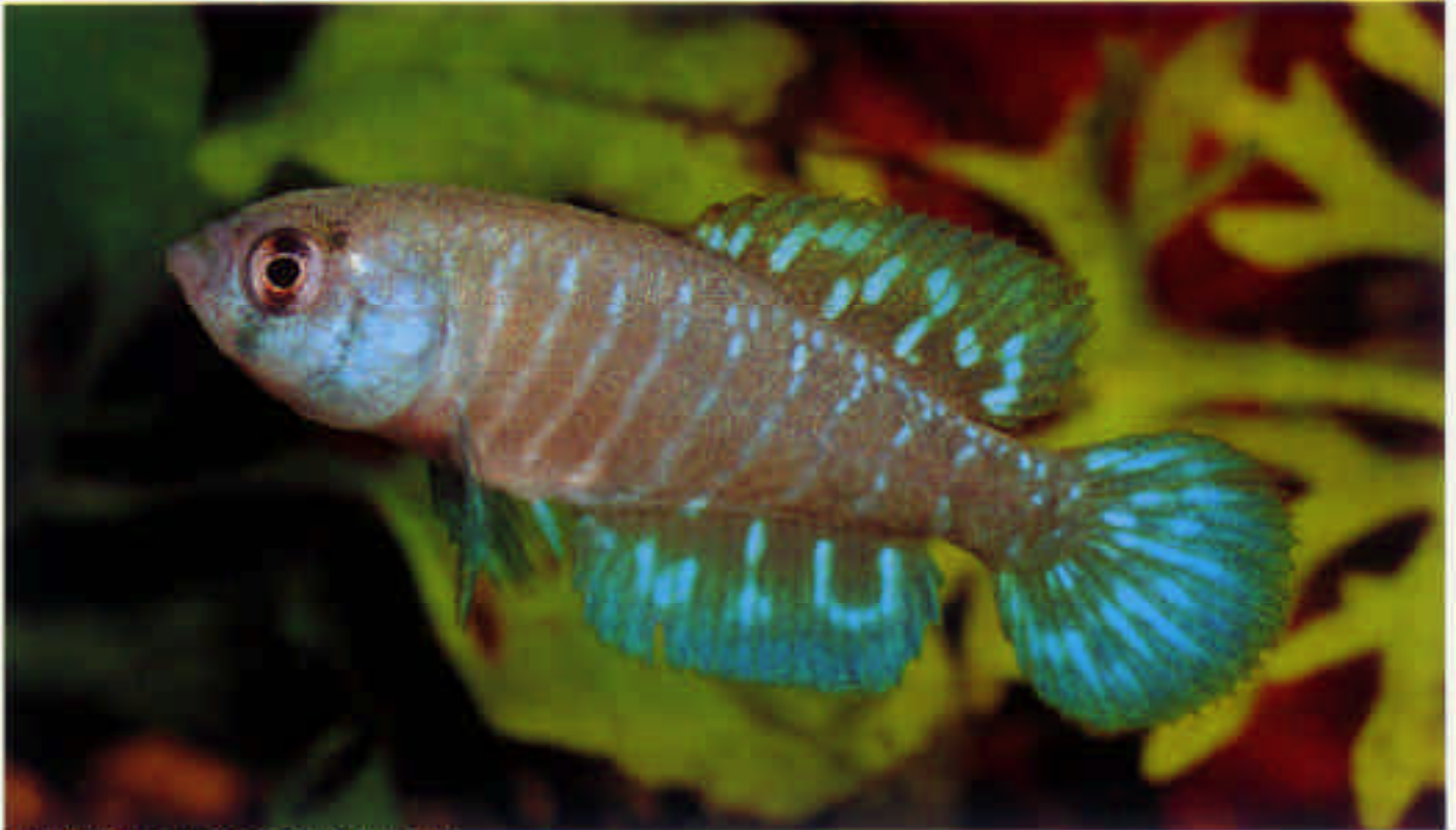
シノレビアス・ドラルズネンシス "タグワレンボ" Cynolebias doraruznensis Tacua Lembo