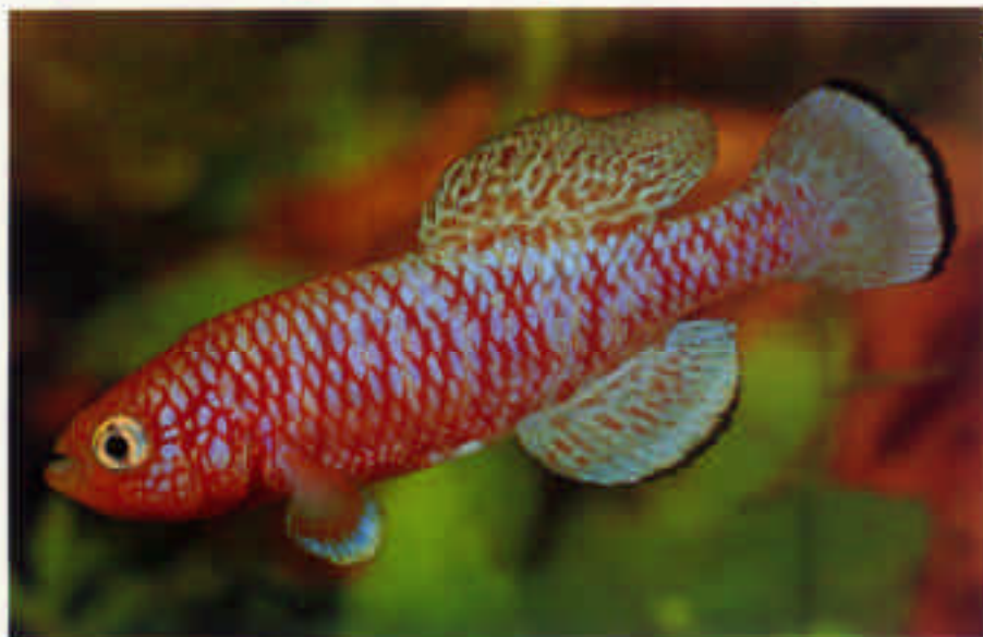
ノブランキウス・カフーエンスイー"カユニ" Nothobranchius katuense Kayuni