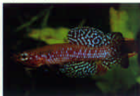
ダイアプテロン・サイアノスティクタム"サム" Diapteron cyanostictum Sam