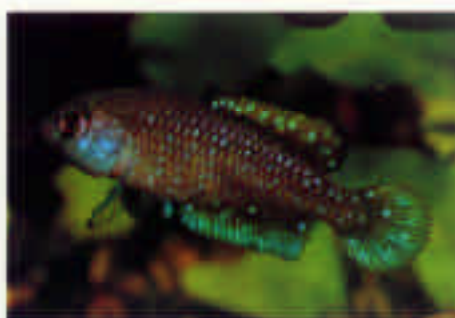
シノレビアス・アフィニス Cynolebias affinis