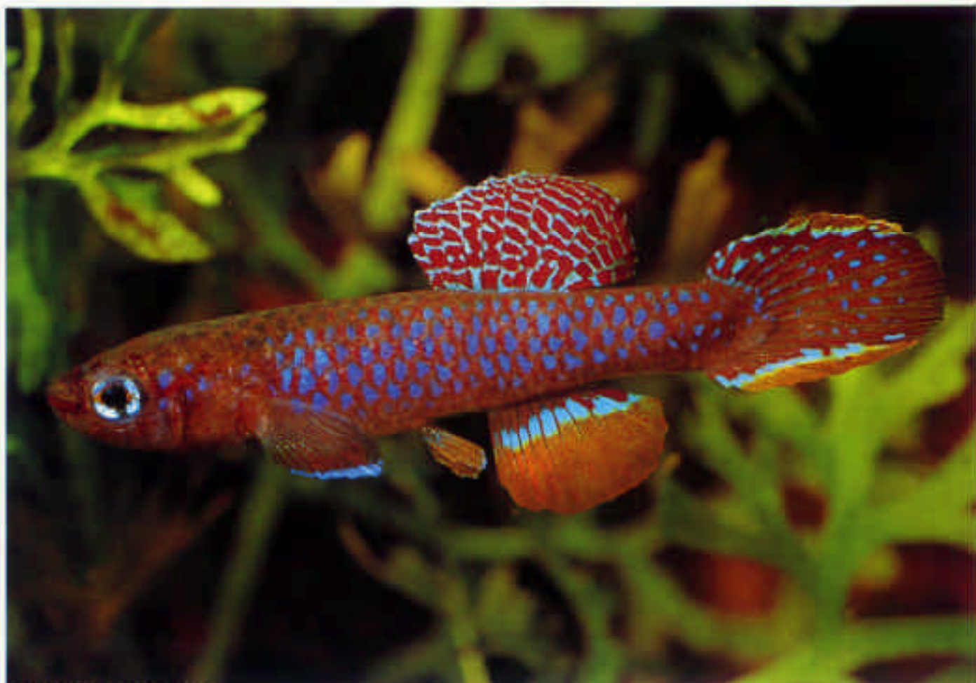
ダイアプテロン・フルジェンスⅢ Diapteron fulgensis III