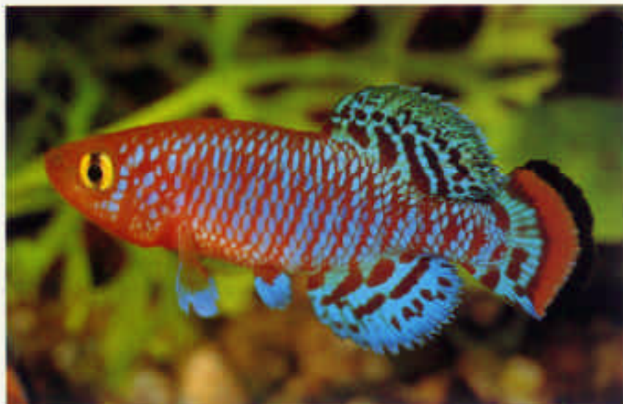
ノブランキウス・ラコビー RK ストライプブルー Nothobranchius rachovii "RK" Stripe Blue