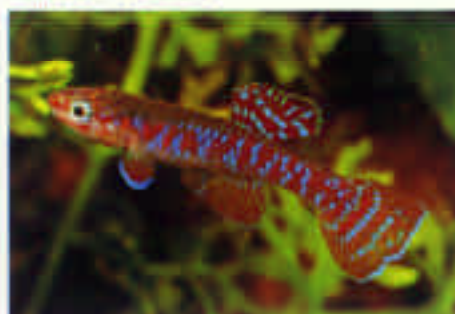
ダイアプテロン・アバシナム Diapteron abacinum