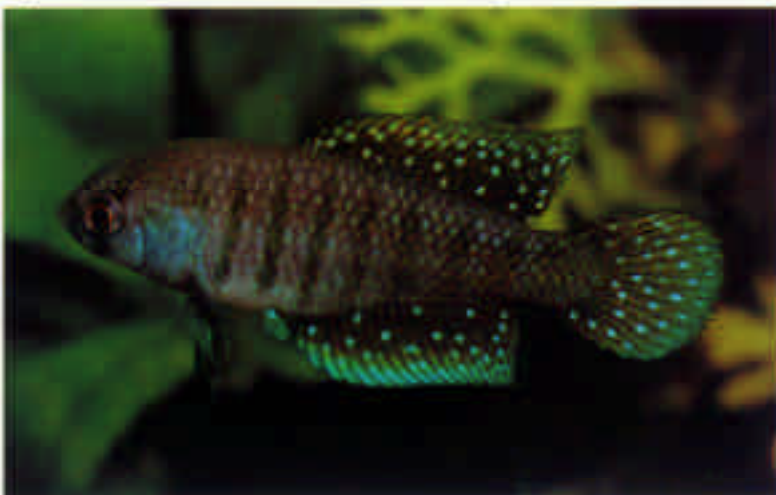
シノレビアス・アレキサンドリー Cynolebias alexandri