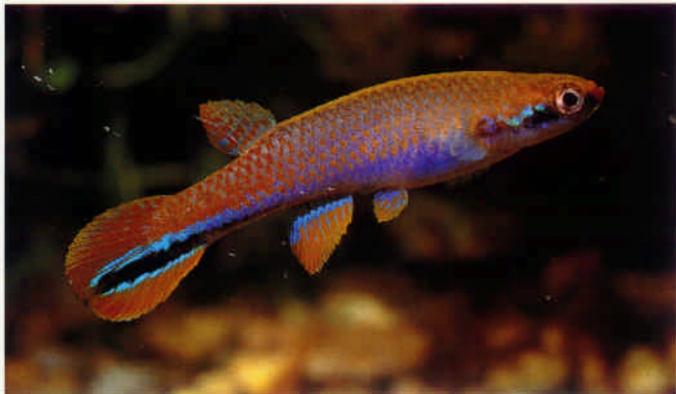
リビュルス・シフィティウス Rivulus xiphidius