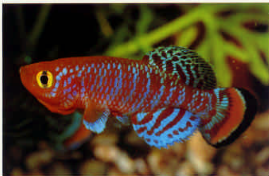
ノブランキウス・ラコビー RK レッドストライプ Nothobranchius rachovii "RK" Red Stripe