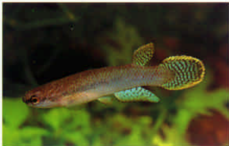
リビュルス・パンクテータス "ウルグアイ" Rivulus punctatus Uruguay