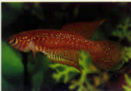
シノレビアス・ホワイトアイ Cynolebias whitei