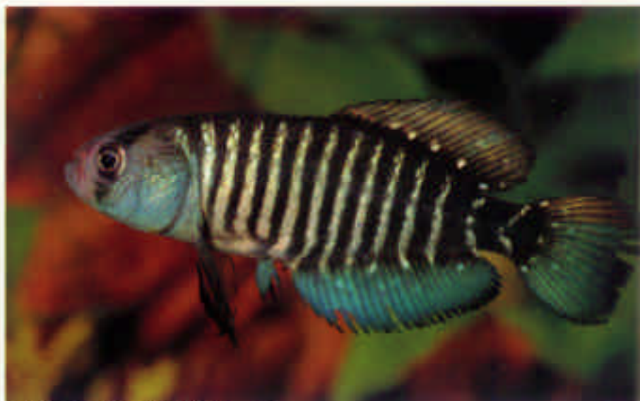
シノレビアス・アドロフイ(?) "チューイ" Cynolebias adloffii (?) Chui