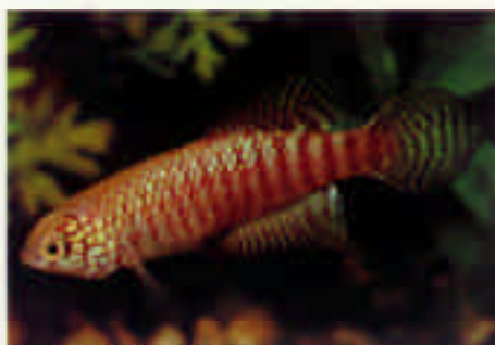
シノレビアス・マイアシー Cynolebias myersi