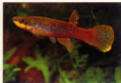
リビュルス・アギライ Rivulus agilis