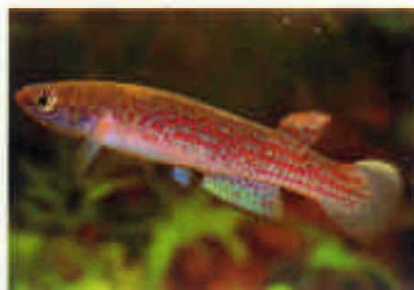
リビュルス sp. "コロンビア" Rivulus sp. Colombia