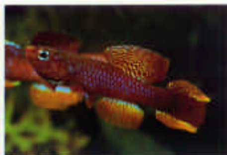
ダイアプテロン・フルジェンスⅠ Diapteron fulgensis I