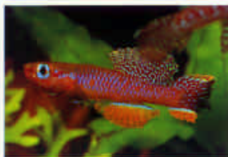
ダイアプテロン・フルジェンスⅡ Diapteron fulgensis II