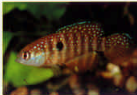
シノレビアス・ナトゥス Cynolebias natus