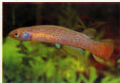
リビュルス・ティニューイス "タルパ" Rivulus tenuis Talpa